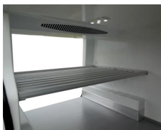
Option étage à clayettes aluminium