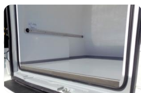
Binari di ancoraggio