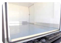
Pavimento pallettizzabile e protezione delle ruote.