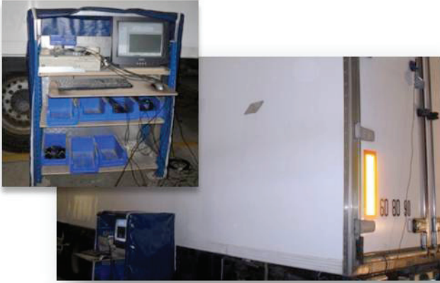
Test de descente en température pour renouvellement d'agrément (6 ans, 9 ans).