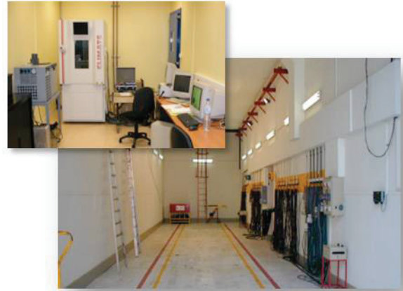
Tunnel CEMAFROID pour test et définition du coefficient d'isothermie "K" d'un véhicule type.