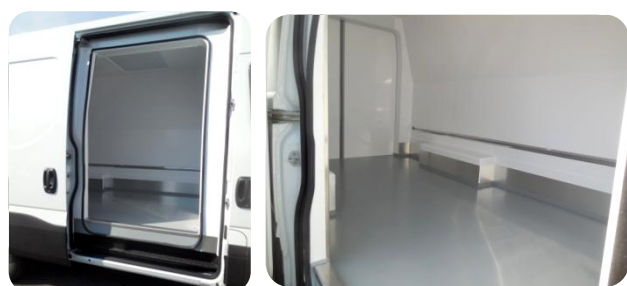
Porte latérale coulissante isolée avec double joint périphérique et seuil latéral marée