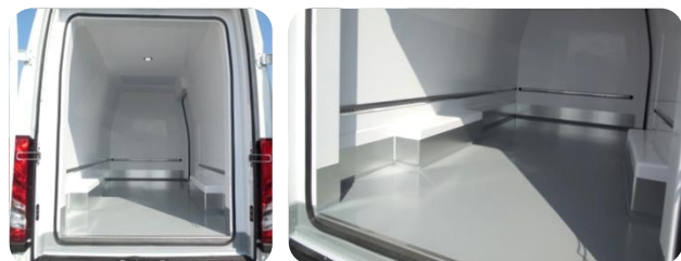
Plancher palettisable (monte simple) et protection de caisson de roue antichoc

Génératrice CARRIER Pulsor disponible sauf 3.0l 205 : nous consulter.