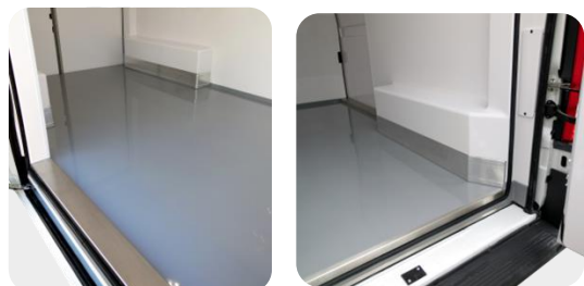
Protection des passages de roue et seuils