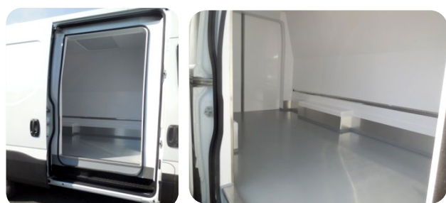
Porte latérale coulissante isolée avec double joint périphérique et seuil latéral marée