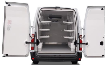
Option étagères réglables et relevables

Revêtement de plancher gel-coat lisse et aluminium antidérapant ; lisses aluminium en plinthe ; lisses de protection aluminium sur faces latérales ; rails d'arrimages aluminium à perforations rondes type aéro ; étagères réglables et relevables ; étage intermédiaire à clayettes ajourées amovibles ; seuil marée arrière et latéral ; rideaux anti-déperdition ; Marchepied d'accès latéral escamotable Quickstep ; Second bandeau LED en entrée de porte latérale.