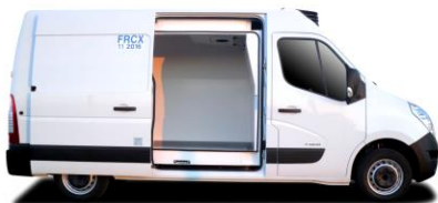
Porte latérale coulissante isolée extra-large

2.3 dCi 130 | 145 | 165 Euro VI & CARRIER PULSOR: sans boîte auto, avec CABADP, sans PFMOT